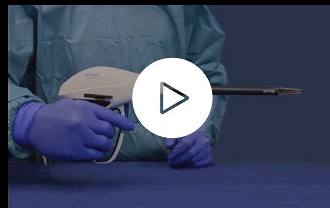
Cum se utilizează