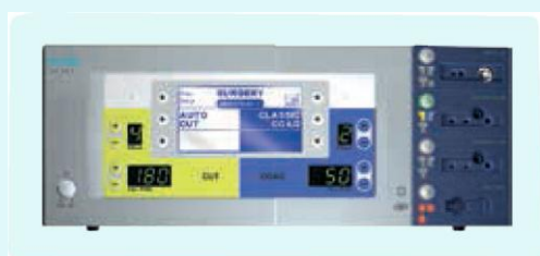
VIO 300 S VIO 200 S Nr. 10140-300 Nr. 10140-400