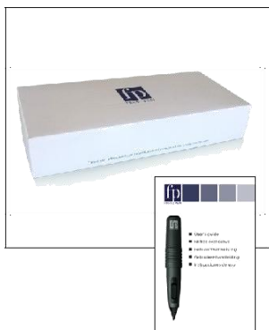
Set de instrument Freezpen cu Manual de utilizare și pensete pentru plasarea filtrului. Pregătit pentru tratarea leziunilor de Ø 2-6 mm. Număr de referință: CL-FP-00