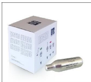
Cutie cu 15 capsule N 2 O de 8g fiecare. Număr de referință: CL-N2O-8G-BOX