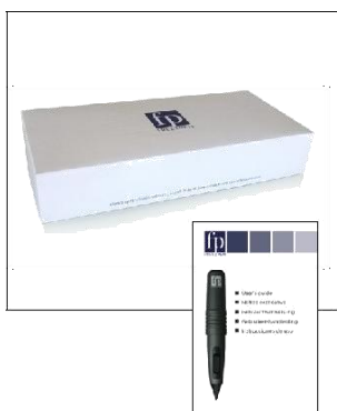
Set de instrumente Freezen cu Manual de utilizare și pensete pentru plasarea filtrului. Pregătit pentru tratarea leziunilor de Ø 2-6 mm. Număr de referință: CL-FP-00