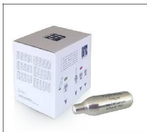
Cutie cu 15 capsule N 2 O de 8g fiecare. Număr de referință: CL-N2O-8G-BOX