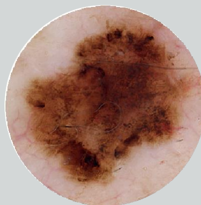
Prezentare cu unul dintre noile dermatoscoape DELTA

Când vine vorba despre cel mai mic detaliu. Noul sistem optic acromatic HEINE, instalat pe cele două noi dermatoscoape din seria DELTA, oferă iluminare optimă până la marginile exterioare. Lumina este distribuită omogen și uniform peste întregul câmp de vizualizare.